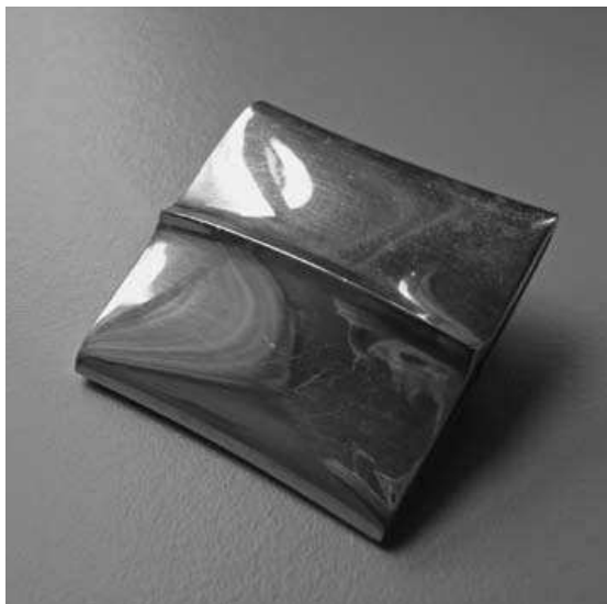
Françoise van den Bosch, Kussenobject, 1972, aluminium buis

en al, voor de vrolijke noot zorgen in een soms duf eruit ziende penningcollectie. Er bestaat geen optische verwantschap meer tussen voorwerpen die penningen heten en voorwerpen die zo dienen te worden genoemd. Ze onder één noemer samenbrengen lijkt wel een grap. De maker moet tegenwoordig expliciet bij het object vermelden dat het als penning bedoeld is. Wij vragen ons af of dit een zinvolle ontwikkeling is.