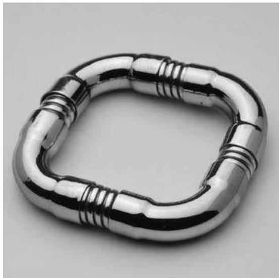
Marion Herbst, Armband, 1971, verchroomd koper en doucheslang