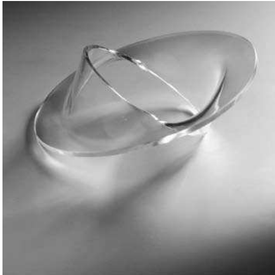
Gijs Bakker, Cirkel armband, 1967, perspex, 116mm

mate bij exposities tussen penningen, soms met een bijpassend foedraal. Alle penningkaders zijn vervallen, behalve de beperkingen in het formaat. Een object kan daardoor, met verpakking