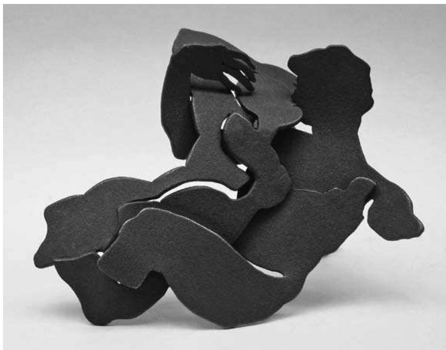
Linda Verkaaik, De Kus, 2004, verkoperd staal ( \frac{1}{3} ware grootte)

Bij penningen werden de meeste modellen gevormd door ze te boetseren of modelleren in klei of was, om daarna door gietmethoden ze te bestendigen, bijvoorbeeld in brons. Harde keramische modellen waren geschikt voor de zandvorm bronsgietmethode. Daarnaast werden er -grotere- modellen gemaakt voor reductie ten behoeve van slagpenningen, een techniek geschikt voor grote oplagen. Het contrast in werkwijze tussen design-objecten en penningen bleef grotendeels bestaan, behalve bij in brons gegoten objecten die tegen de penningkunst aanleunden. Naarmate beeldhouwers die niet in design onderlegd waren, min of meer in de designrichting penningen gingen maken, ofwel in staat waren 'objecten' te maken, al dan niet voor (re)productie, veranderde de aard van de visie op de penningkunst en werd er een overlap verondersteld tussen penningen en dergelijke objecten. Zelfs in penningkrin-