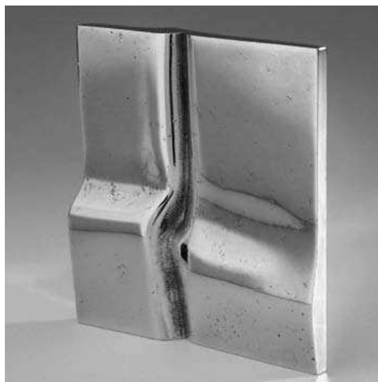
Frans de Wit, Penning, 1975, messing ( \frac{1}{4} ware grootte)