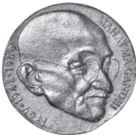
Gandhi-penning door Joop Hekman

Als je bijvoorbeeld kijkt naar De Beeldenaar , zie je zelden artikelen over penningen van historisch belang, over buitenlandse penningen of over thema's in de penningkunst. Je ziet wel regelmatig recente penningen en voorwerpen die daar door hun makers toe gerekend willen worden. Verder staan er jaarlijks de jaar- en inschrijfpennings van de VPK in. Naar mijn smaak ligt het accent van de artikelen nogal zwaar op de verlegging van de begrenzing van het medium en het vak. Ook de door mij verzorgde