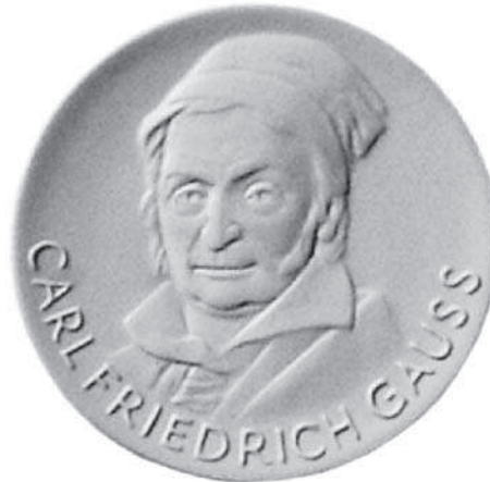
Historische penning: C.F. Gauss

Als je in contact komt met penningverzamelaars zie je voor een groot deel steeds dezelfde penningen. Voor mij zijn dan alleen die penningen interessant die ik nooit eerder zag of die ik zelf niet bezit, maar wel had willen hebben. In dat licht scoort de VPK als bron voor de aanvulling van mijn collectie de laatste jaren niet hoog. Je kunt naar eigen smaak en voor vrijwel elke beurs tal van aardige penningen kopen: bij kunstenaars, bij galleries, op verzamelaarsmarkten, tijdens munt- en penningveilingen en via het internet. Daarmee is een vereniging die twee penningen per jaar uit geeft in een grote oplage nauwelijks in staat te concurreren. Als ik bovendien de aantrekkelijkheid van de recentere VPK-uitgiften analyseer, moet ik bekennen dat ik me regelmatig afvraag of de vereniging nog wel de penningkunst zelf bedient. De keuze voor opdrachtverstrekking aan een kunstenaar die op een ander terrein bekendheid geniet, lijkt belangrijker geworden dan de garantie voor een vakkundig resultaat op een echte penning. Dat leidt meestal niet tot rond en plat, om het maar kort door de bocht te formuleren. Alsof het een handicap is dat het in een rondje moet. Bij de zogeheten echte (traditionele) pen-