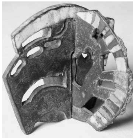
Yin-Yang

Hoe je het went of keert, Beuys is een fascinerende figuur. Elk zichzelf respecterend museum met moderne kunst besteedt aandacht aan hem. Om beter te begrijpen wat hij bedoelt, ben ik naar museum Schloss Moyland nabij Kleef getogen. Daar is de grootste Beuys-collectie gehuisvest: 5000 werken als ik het wel heb en 100.000 aanvullende documenten. Van de 5000 werken worden er ongeveer 1000 getoond. Beuys daagt de kijker uit en geeft hem het recht te oordelen. Door hem zelf gerechtigd en door zijn werk aangemoedigd voelde ik mij vrij zijn werk overwegend troep te vinden. Ik bedoel dit niet cynisch, want het is bepaald een prestatie als je kans ziet om de doorgaans onzekere kunstbeschuwer vaste grond onder zijn voeten te verschaffen. Het werkt bevrijdend als je zelf mag bepalen wat kunst is en alleen al om die bevrijdende ervaring is een aandachtig bezoek aan de Beuys-collectie de moeite meer dan waard. Waarbij ik uitdrukkelijk aantekenen dat mijn conclusie over zijn werk niet absoluut is, maar strikt persoonlijk.