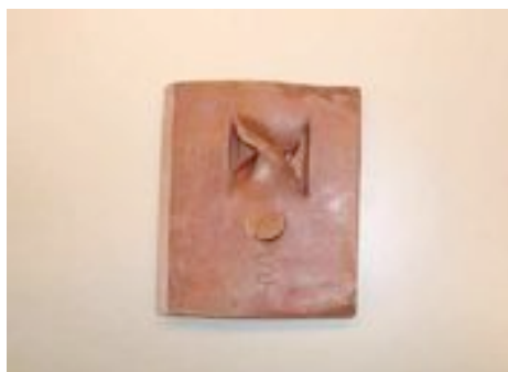
De Holst penning

Jos bleek nog meer gedaan te hebben: Met een glas drinken in onze hand, toonde hij ons voorbeelden van de 600 ontwerpen die hij in de afgelopen 40 jaar voor de Vlisco in Helmond, dé katoendrukkerij voor Afrika, heeft gemaakt. Hij tekent graag en veel en daar hebben we