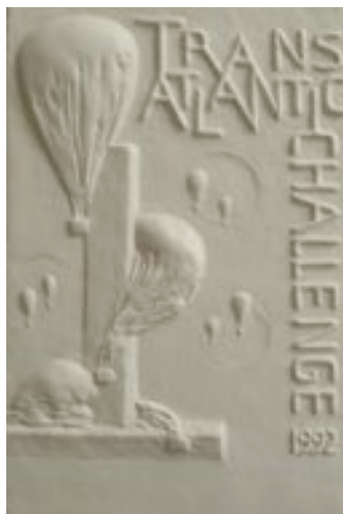
TransAtlantic Challenge 1992 materiaal: witte kunststof (prototype) maten: 13,4 x 9 cm ontwerp: Mary Olson (1969 VS)

De grote ballonvaart werd in 1992 nog ingezet als aandachtstrekker voor het fenomeen van hoe, varend op de wereld luchtstromen, de ballonnen door de Amerikaanse hoogbouw als door een magneet werden aangetrokken voor het vieren van hun eindbestemming tijdens een wedstrijd. Deze vorm van luchtvaart moest op een beeldende wijze neerzigen naast een machtige wolkenkrabber. Het aardige aan deze plaquette is dat die eigenlijk een penning had moeten zijn, maar dat dit medium, door gebrek aan hoogterichting te benepen werd gevonden door de opdrachtgever. Die vond dat de grandeur van zowel de ballonvaart als de Amerikaanse hoogbouw teniet zou gaan op een rondje. Als troost voor de penningmaker mochten er toen drie zwevende (ronde) zeepbellen op de achtergrond in het reliëfje worden afgebeeld.